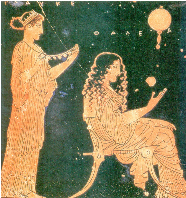
Préparation pour un mariage en Grèce